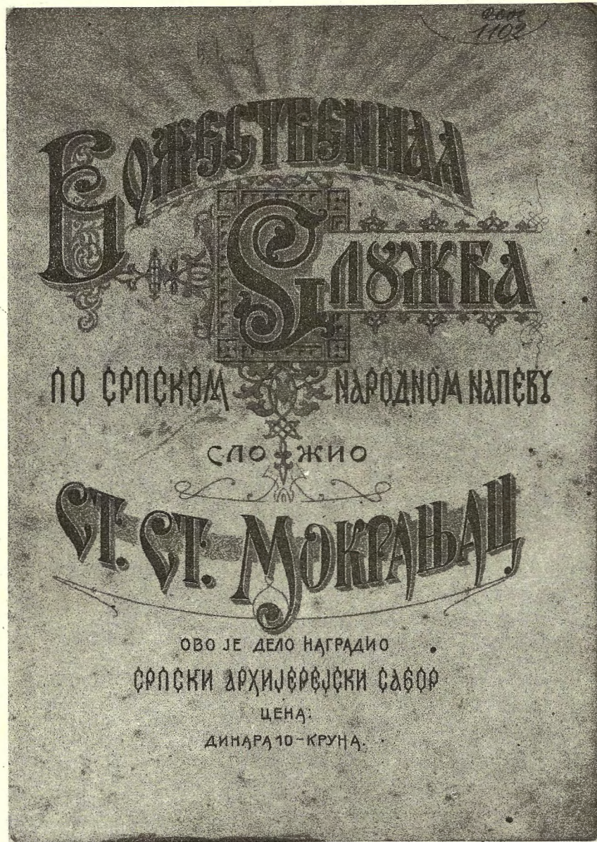
ЛИТУРГИЈА, насловна страна првог издања